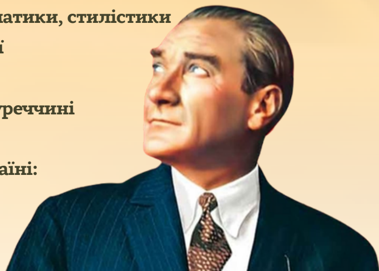
Мустафа Кемаль Ататюрк